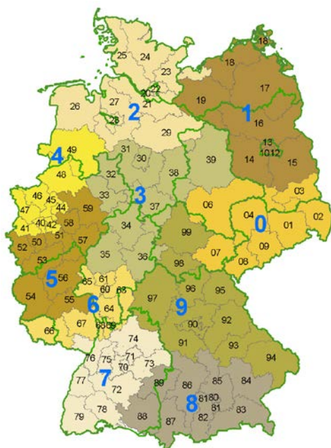
Wetterwerte für 96 PLZ-2-Regionen

Das Klima-Paket beinhaltet einerseits statistisch veredelte Prognosedaten und andererseits historische Datenreihen, die durch hochintelligente Analysealgorithmen berechnet wurden. Zur Ermittlung der repräsentativen Gewichte werden unter anderem die Einwohnerdichte, die Höhe der Stationen über dem Meeresspiegel, die geografische Lage sowie die Umgebungsfaktoren herangezogen.